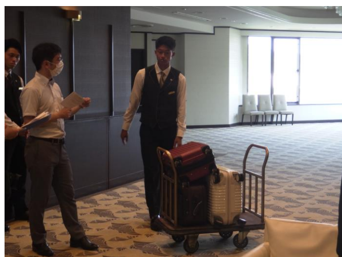
↑バゲージ作業におけるリスク検討を行う様子

伊勢志摩リゾートマネジメント様では、環境上の制約はあるものの通路幅の拡幅や、対滑性のある靴を配布するなど、さまざまな環境改善を行っていました。