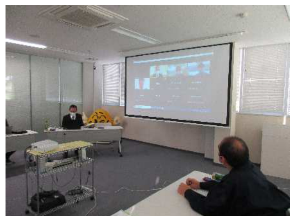
会場（株式会社マस्या様）での会議の様子

【URL】 https://jsite.mhlw.go.jp/mie-roudoukyoku/kantoku/ise04.html